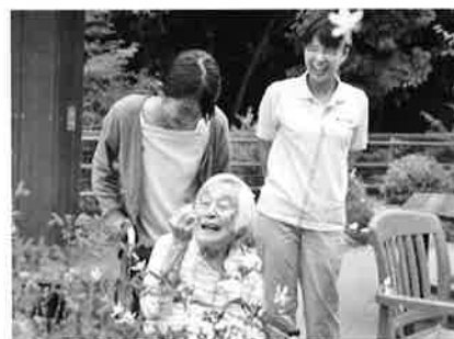
山陽学園大学 生活心理学科 2021年卒

主体的に仕事の経験ができたので参加してよかったです。介護や福祉の勉強をしていない方も、参加すれば仕事のイメージが掴めると思います。