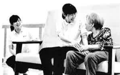
岡山県立大学 保健福祉学科 2020年卒

ボランティアに何度か行かせていただいた事業所がインターンシップ生を受け入れていると知り、何か新しい体験ができるかもしれないと思い参加してみました。障害者支援に意識が向きがちだった私でしたが、4日間のプログラムでは特養や保育園など、幅広く福祉の仕事を経験することができました。また、初めて支援記録をつけ、職員間の情報共有の方法を垣間見ることもできました。インターンシップに参加すると、実習先以外での仕事の体験ができ、視野が広がると思うのでおすすめです。