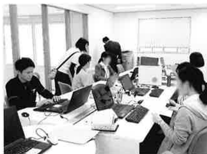
川崎医療福祉大学 医療福祉学科 2019年卒